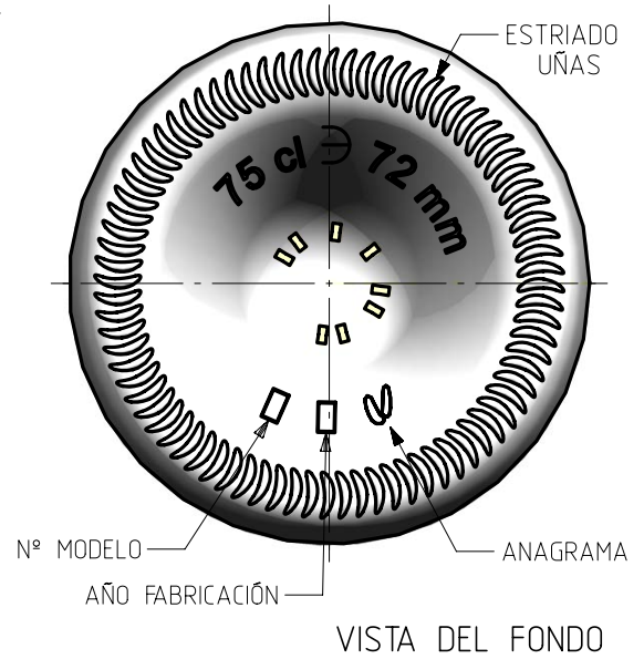
VISTA DEL FONDO