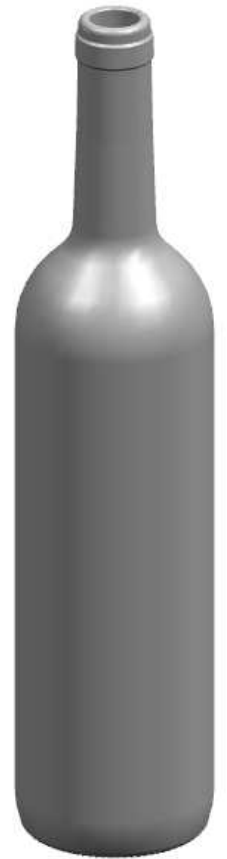
VISTA DEL FONDO