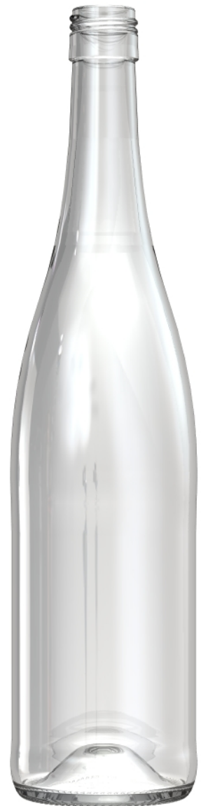
VISTA DEL FONDO