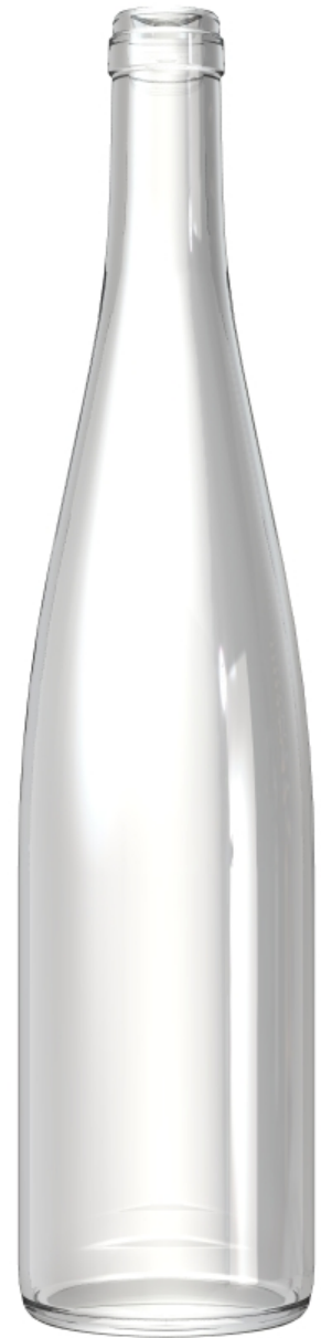
VISTA DEL FONDO